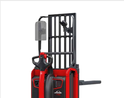
Ergonomischer Hub für eine mühelose Bedienung