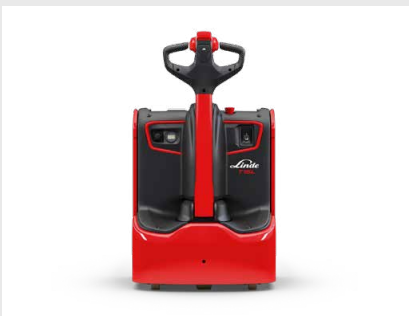
Einfacher Zugriff auf alle wichtigen Komponenten