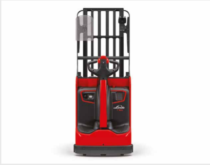
Lange Deichsel und tiefgezogenes Chassis